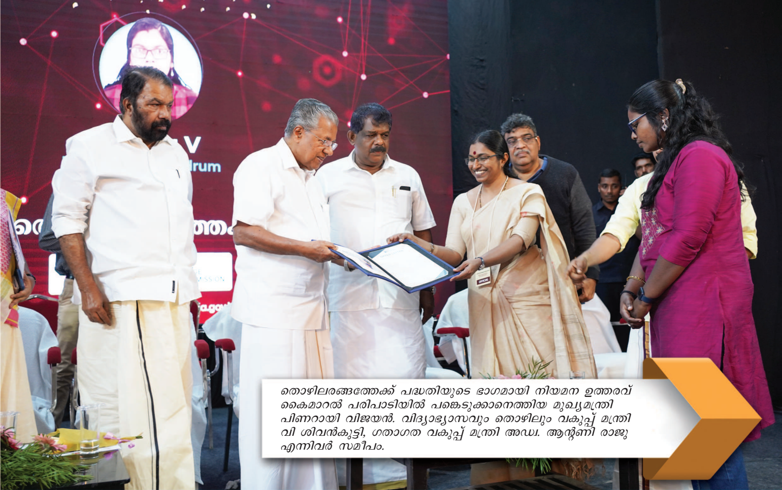
തൊഴിലരങ്ങത്തേക്ക് പദ്ധതിയുടെ ഭാഗമായി നിയമന ഉത്തരവ് കൈമാറൽ പരിപാടിയിൽ പങ്കെടുക്കാനെത്തിയ മുഖ്യമന്ത്രി പിണറായി വിജയൻ. വിദ്യാഭ്യാസവും തൊഴിലും വകുപ്പ് മന്ത്രി വി ശിവൻകുട്ടി, ഗതാഗത വകുപ്പ് മന്ത്രി അഡ്വ. ആന്റണി രാജു എന്നിവർ സമീപം.