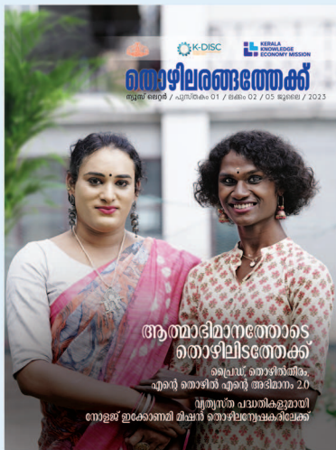
കവർ : പ്രൈം ശിൽപ്പശാലയിൽ പങ്കെടുക്കാനെത്തിയ ദർശനയും പ്രകൃതിയും

ചീഫ് എഡിറ്റർ ഡോ. പി എസ് ശ്രീകല (ഡയറക്ടർ, KKEM) എഡിറ്റർ ശൈലി ഇ പി ലേ-ഔട്ട് & കവർ ഡിസൈൻ കളർ ട്രാക്ക് 9447719387