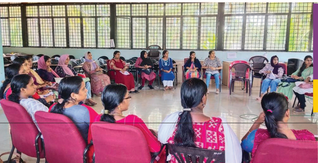
പെരുമ്പടപ്പ് മാറബേരിയിൽ സംഘടിപ്പിച്ച ജോബ് ഓറിയന്റേഷൻ പരിശീലന പരിപാടിയിൽ പങ്കെടുക്കാനെത്തിയ തൊഴിലന്വേഷകർ