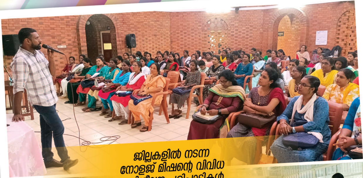
ജില്ലകളിൽ നടന്ന നോളജ് മിഷന്റെ വിവിധ പരിശീലന പരിപാടികൾ