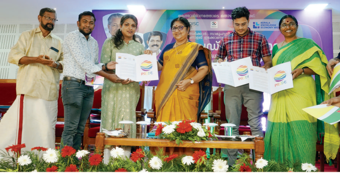
പ്രൈഡ് ലോഗോ പ്രകാശനം