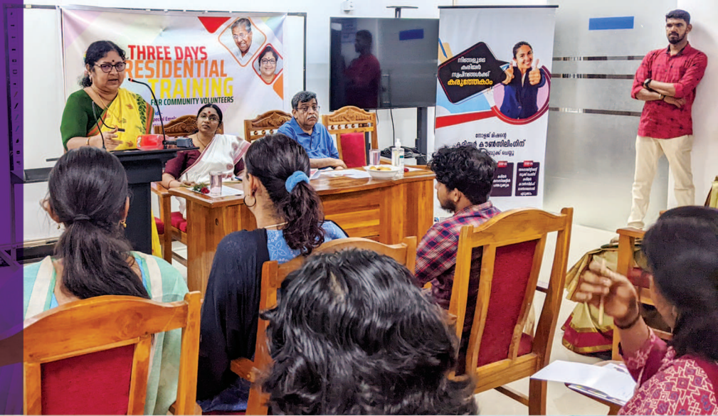
പ്രൈഡ് പദ്ധതിയുടെ ഭാഗമായി നടന്ന ത്രിദിന വോളന്റിയർ പരിശീലനം ഉന്നത വിദ്യാഭ്യാസവും സാമൂഹ്യനീതിയും വകുപ്പ് മന്ത്രി ഡോ. ആർ ബിന്ദു ഉദ്ഘാടനം ചെയ്യുന്നു