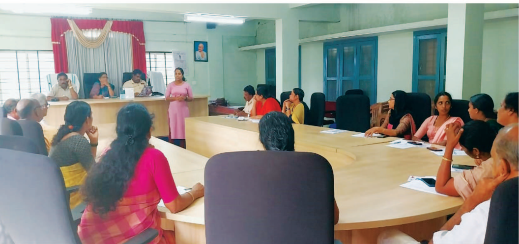
മൈക്രോപ്ലാൻ പദ്ധതിയുടെ ഭാഗമായി സുൽത്താൻ ബത്തേരി അമ്പലവയൽ പഞ്ചായത്തിലെ ജനപ്രതിനിധികൾക്കായുള്ള യോഗം.