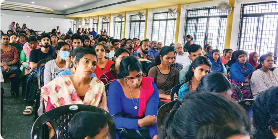
കൊല്ലം കോർപ്പറേഷനിൽ മൈക്രോപ്ലാൻ പദ്ധതിയുടെ ഭാഗമായുള്ള പരിശീലനത്തിൽ പങ്കെടുക്കാനെത്തിയ ഉദ്യോഗാർഥികൾ