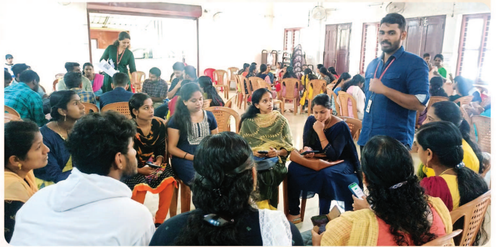
ബൈസൺവാലിയിൽ സംഘടിപ്പിച്ച ജോബ് ഓറിയന്റേഷൻ, കരിയർ ക്ലിനിക പരിശീലന പരിപാടി.