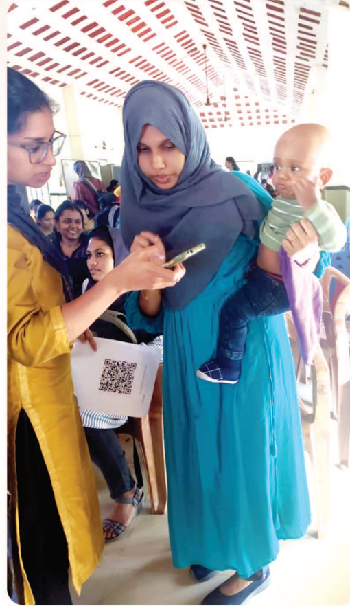
പെരുമ്പടപ്പിൽ സംഘടിപ്പിച്ച ജോബ് ഓറിയന്റേഷൻ, കരിയർ ക്ലിനിക പരിശീലന പരിപാടിയിൽ പങ്കെടുക്കാനെത്തിയ ഉദ്യോഗാർഥി