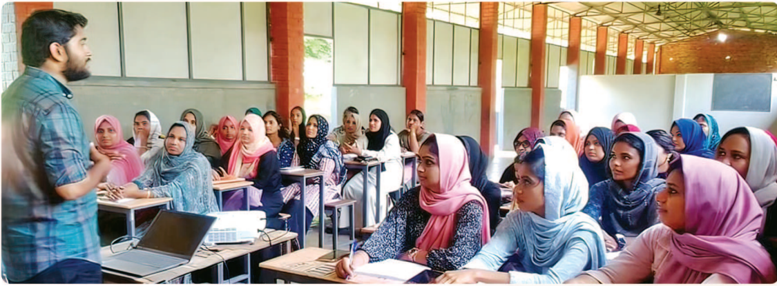
പെരുമ്പടപ്പ് ആലങ്കോട് ഗ്രാമപഞ്ചായത്തിൽ നടന്ന വർക്ക് റെഡിനസ് പ്രോഗ്രാം